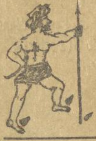
„Engkel“ ni App.

„Soemoehar, pane haroa inna hasida Appandjoenggal ibagat rohana Ai somal la tian na robi poro sahat toe saonari sai halak do masitip poesoknga ala ni engkella paidada manang oembege hata ni Appandjoenggal.